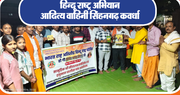
हिन्दू राष्ट्र अभियान आदित्य वाहिनी सिहनगढ़ कवर्धा