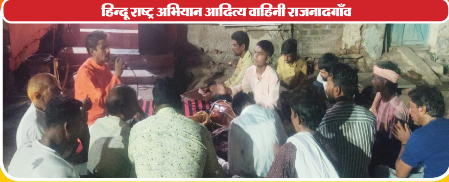
हिन्दू राष्ट्र अभियान आदित्य वाहिनी राजनादगाँव