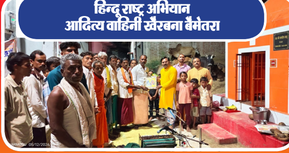
हिन्दू राष्ट्र अभियान आदित्य वाहिनी खैरबना बैमंतरा