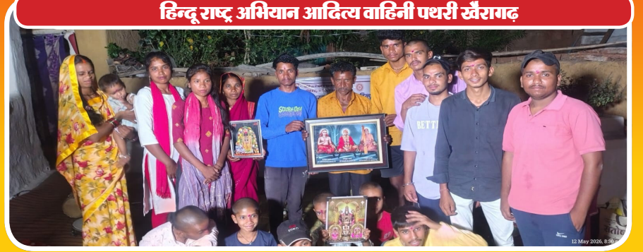
हिन्दू राष्ट्र अभियान आदित्य वाहिनी पथरी खैरागढ़