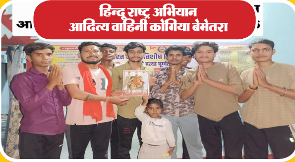
हिन्दू राष्ट्र अभियान आदित्य वाहिनी काँगिया बैमंतरा