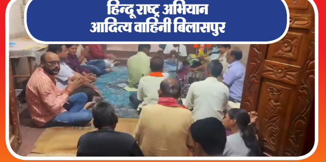
हिन्दू राष्ट्र अभियान आदित्य वाहिनी बिलासपुर