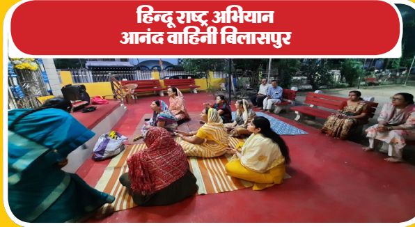
हिन्दू राष्ट्र अभियान आनंद वाहिनी बिलासपुर